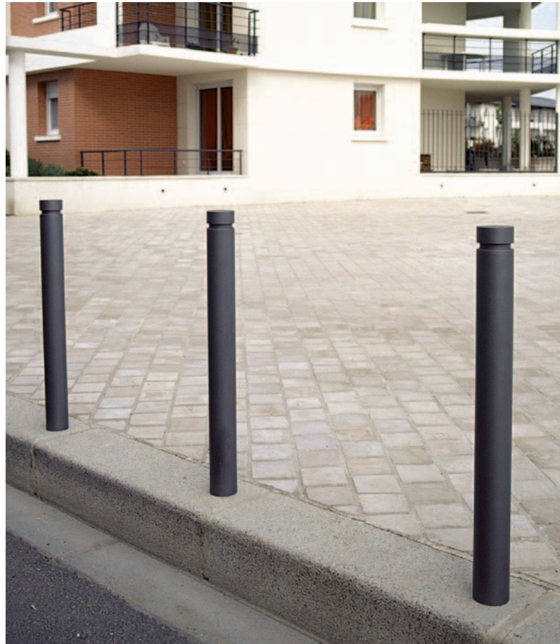
Potelet Basic 1